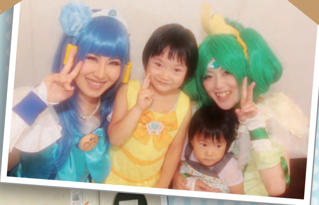
はい！チーズ☆ カメラを持ってサイエンスヒルズこまつへおでかけしよう♪