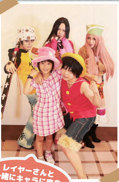
レイヤーさんと一緒にキャラに変身パシャッ☆